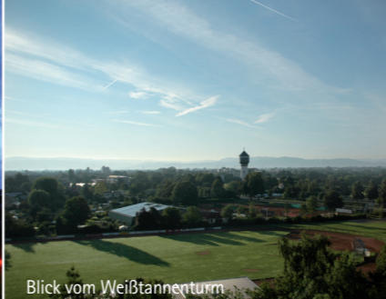
Blick vom Weißbannenturm