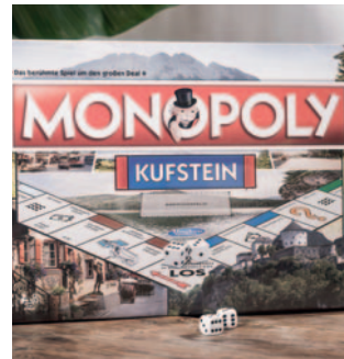
Kufsteinerland Monopoly € 39,90