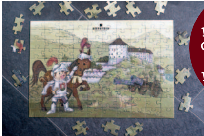
Kinderpuzzle „Festung Kufstein“ € 5,00

Mit der Kufsteinerland Card erhältst Du auf alle unsere Produkte im Shop 5 % Rabatt.