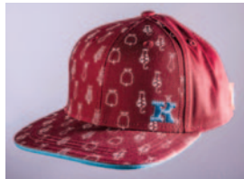
Kinder Cap „Kufstein“ weinrot € 10,00