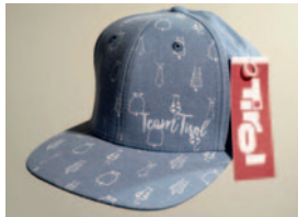
Kinder Cap „Team Tirol“ jeansblau € 10,00