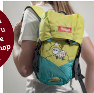
Kinderrucksack € 34,90

Mit der Kufsteinerland Card erhältst Du auf alle unsere Produkte im Shop 5 % Rabatt.