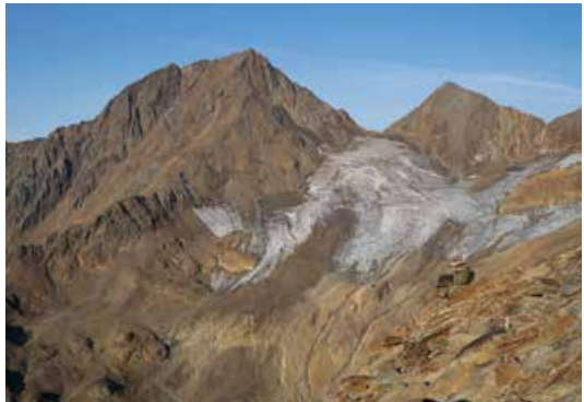
Der Steinschlagferner in den Ötztaler Alpen, der deutliche Zerfallserscheinungen zeigt

Georg Kaser hat am 4. und 5. Sachstandsbericht des Weltklimarates IPCC mitgearbeitet und ist nun auch im laufenden 6. Berichtszyklus aktiv (um Umsetzungsstrategien zu entwerfen und festzulegen, wurde der Weltklimarat IPCC beauftragt, zu untersuchen, wie unterschiedlich die zwei Klimaziele sind, wie sehr sich die jeweiligen Auswirkungen von den heutigen Verhältnissen unterscheiden und wie die Ziele erreichbar sind).