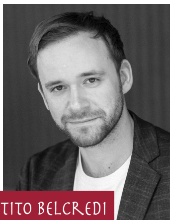
BARON TITO BELCREDI