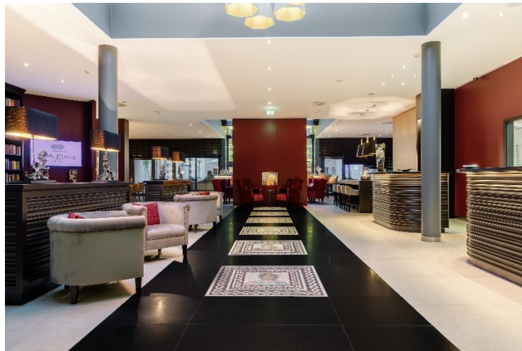
Park Plaza Trier