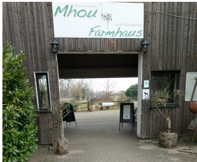
Eingang zur Straußenfarm Mhou