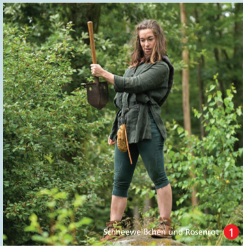
Schneeweißchen und Rosenrot 1

Das ausführliche Programm finden Sie im Innenteil dieses Flyers.