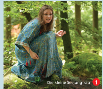
Die kleine Seejungfrau 1

Die Tabelle „Hier ist was los!“ informiert Sie über die Darbietungen nach Spielorten geordnet.