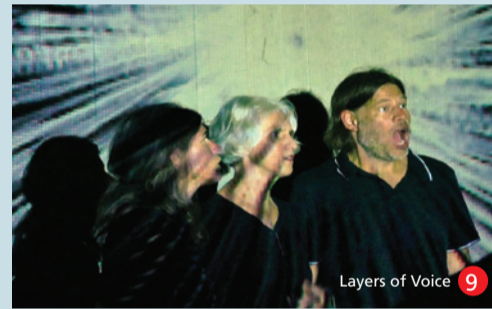
Layers of Voice 9