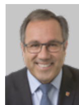
Landrat Gregor Eibes Vorsitzender der Regionalinitiative

Die „Woche der Artenvielfalt“ startet erstmalig mit einem Symposium des DLR Mosel am 14. Mai 2022 in Bernkastel-Kues. Mit dieser Auftaktveranstaltung setzt das DLR Mosel den Fokus auf den Weinbau und thematisiert die Frage, warum die Zukunft des Weinbaus und die regionale Identität so wichtig für die Artenvielfalt sind. Am 22. Mai 2022 endet die Veranstaltungswoche mit dem Aktionstag „Artenvielfalt rockt die Mosel“ in Bernkastel-Kues. Hier präsentiert die Regionalinitiative „Faszination Mosel“ die Vielfalt der Moselregion in einem bunten Programm für Groß und Klein. Wir sind ganz begeistert, wie viele Akteure im gesamten Moselraum dem Projektauftrag gefolgt sind und sich mit ihren Veranstaltungen und Aktionen in dieser Woche engagieren: Schauen Sie in das Programm mit rund 80 Angeboten und lassen Sie sich von dem besonderen Artenreichtum unserer Heimat faszinieren. Alle Veranstalter*innen haben sich große Mühe gegeben und ein Erlebnis für Sie vorbereitet: Unterstützen Sie die Veranstaltungen durch Ihren Besuch und wählen Sie vielleicht zur Abwechslung mal einen Ort aus, den Sie bisher nicht kennen! Wir wünschen Ihnen eine aktive und erlebnisreiche Woche und freuen uns, wenn viele Gäste die Veranstaltungen besuchen.