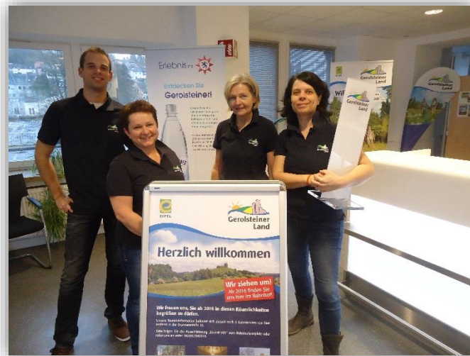
Das Team der Touristinformation Gerolsteiner Land