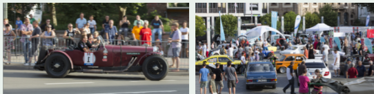
„Kaiserslautern Classics“: When vehicles become a passion

Am 22. Juni um 8.30 Uhr machen sich die Rallye-Teilnehmer dann vom Möbel Martin auf zu zwei weiteren erlebnisreichen Etappen, unter anderem nach Rockenhausen, bis sie nachmittags in die Barbarossastadt zurückkehren. Bevor die Fahrzeugklassiker und ihre Besitzer das Ziel am Stiftsplatz erreichen, werden sie ab 16.30 Uhr bei der „City-Präsentation“ in der Fruchthallstraße, Höhe „K in Lautern“, auf der Zielgeraden nochmals vorgestellt. Empfangen werden sie von den Kaiserslauter Pikes-Cheerleadern.