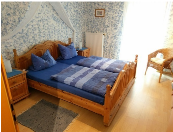
Ferienwohnungen Christa, Haus 53