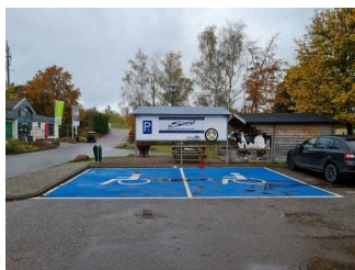
Parken vor der Rezeption

Wir haben für Sie einige Fotos aus dem Betrieb / Angebot zusammengestellt. In den Detailberichten finden Sie weitere Fotos.