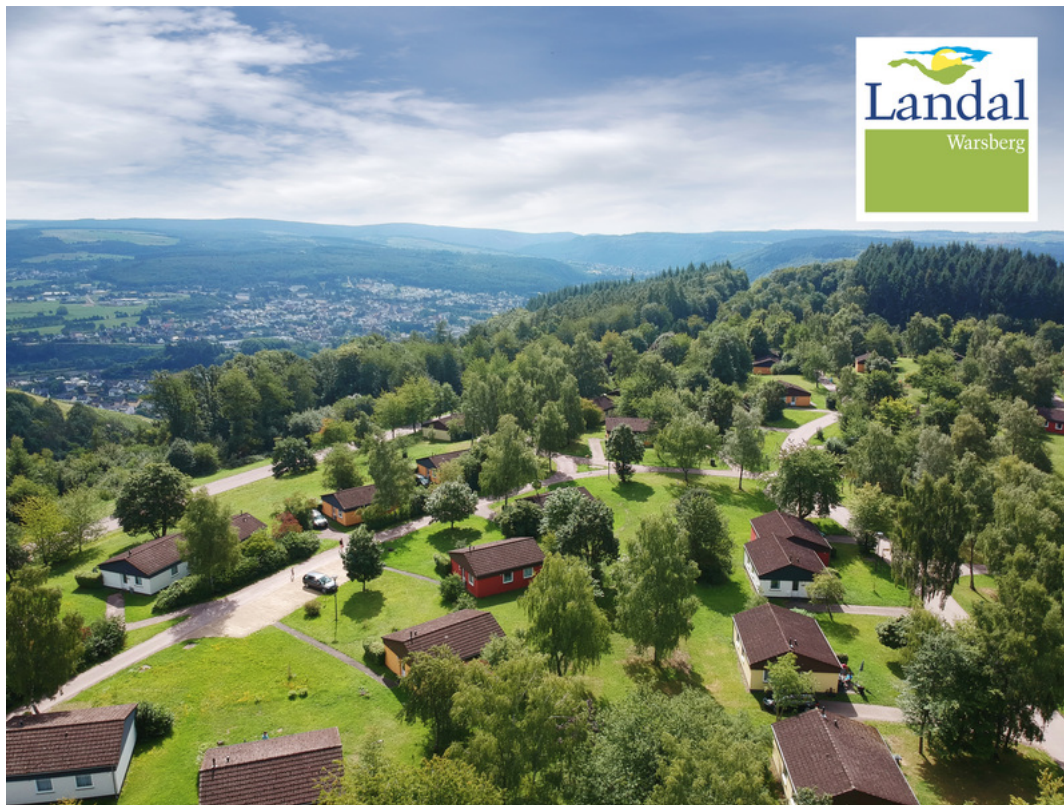
Ferienpark Landal Warsberg