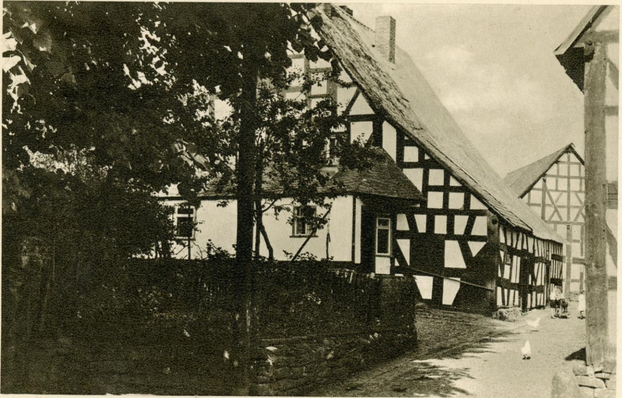
Das Zentgrafenhaus in Rennerod im Westerwald, um 1300 erbaut