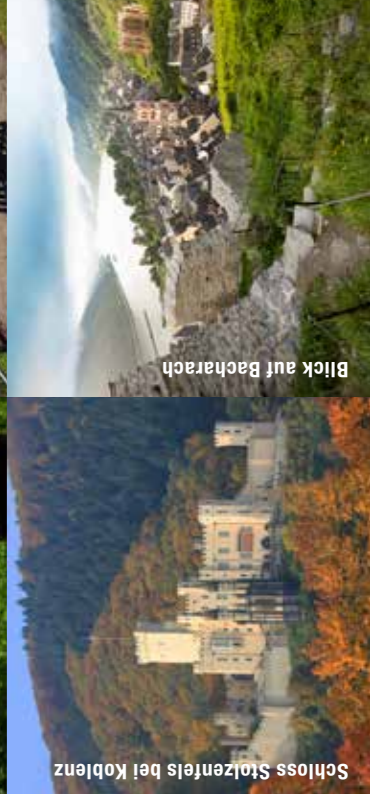
Schloss Stolzenfels bei Koblenz