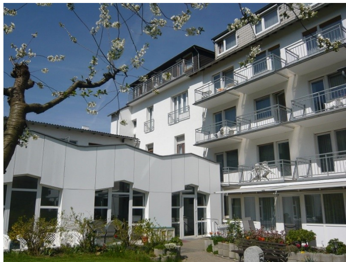
Kurhotel Haus Klement