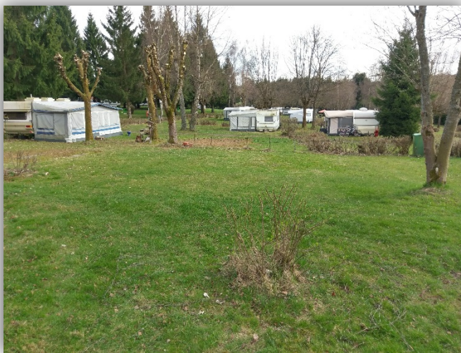
Campingpark Hofgut Schönerlen