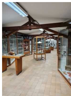
Ausstellungsräume Freilichtmuseum Roscheider Hof