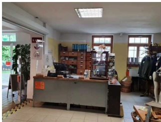
Kasse Freilichtmuseum Roscheider Hof