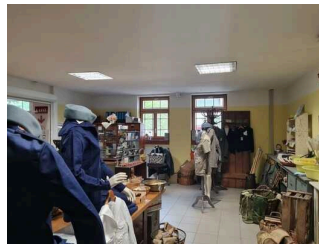
Shop Freilichtmuseum Roscheider Hof