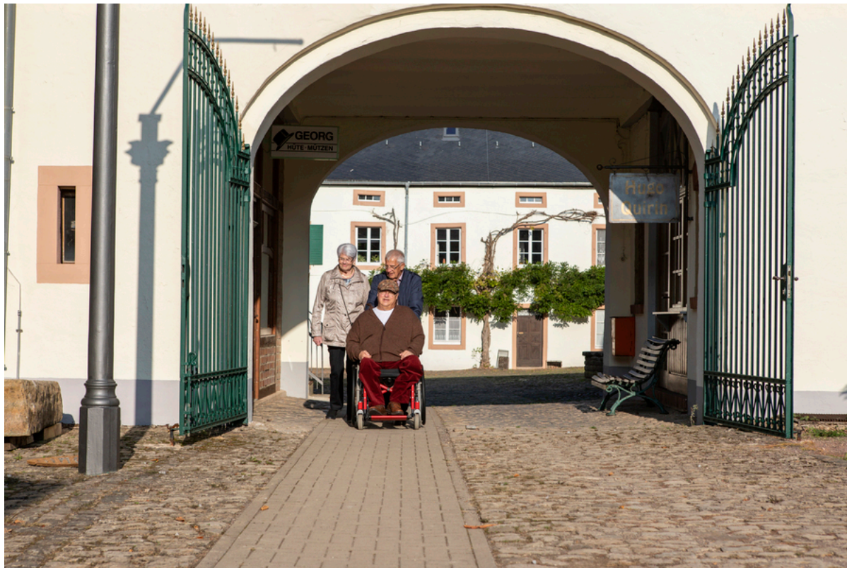
Freilichtmuseum Roscheider Hof | ©Anna-Lena Koster