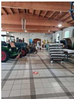
Ausstellungsräume Freilichtmuseum Roscheider Hof