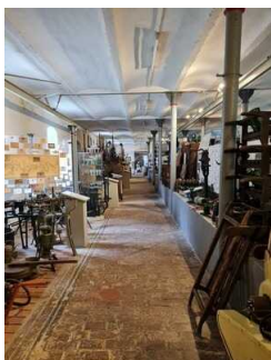
Ausstellungsräume Freilichtmuseum Roscheider Hof