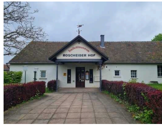
Eingangsbereich Freilichtmuseum Roscheider Hof