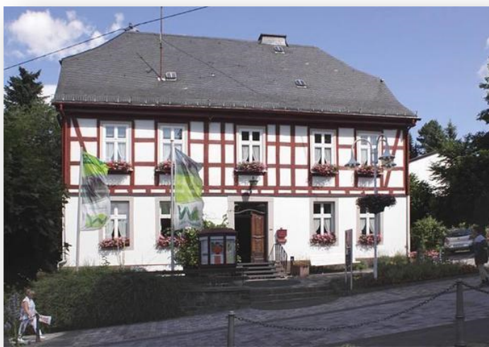
Öffentliches WC an der Touristinformation Bad Marienberg