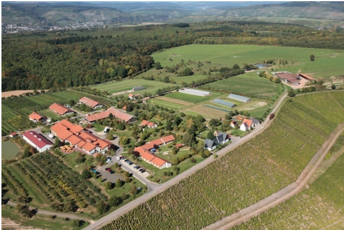
Lebenshilfe–Werke Trier GmbH, Betriebsstätte Hofgut Serrig