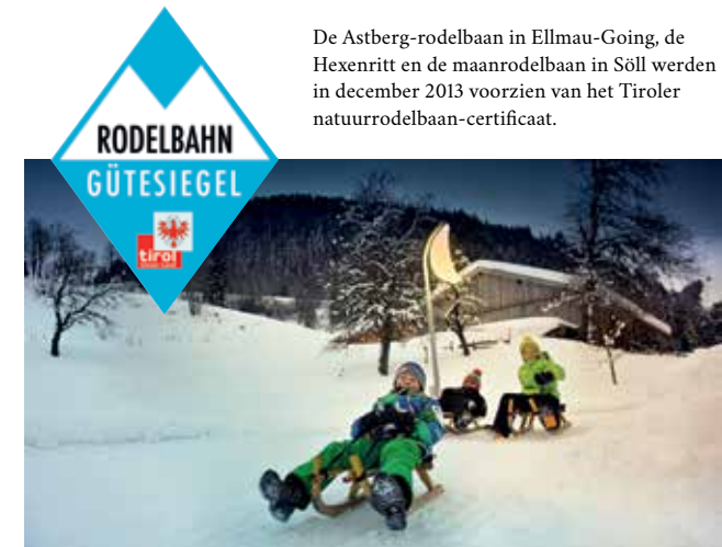
De Astberg-rodelbaan in Ellmau-Going, de Hexenritt en de maanrodelbaan in Söll werden in december 2013 voorzien van het Tiroler natuurrodelbaan-certificaat.

Wintergaudi naast de piste. Neem in plaats van ski's, een slee en raz door het sneeuwbos. Met hun natuurlijke en bovendien best onderhouden rodelbanen is de regio Wilder Kaiser een geliefde ontmoetingsplaats voor rodelaren. Meer dan 14 kilometer sledepistes, verdeeld over 5 rodelbanen en deels besneeuwbaar zorgen ervoor dat de sledes op volle vaart kunnen komen. Romantisch op vorstpaden of sportief van de Astberg en de Söller Hexenritt, hier kan u sportief de bocht ingaan. Gezinnen genieten van de maanrodelbaan in Hochsöll met spannende belevingsstations.