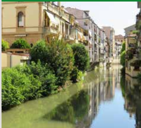
NAVIGLIO INTERNO VISTO DAL PONTE S. GREGORIO BARBARIGO. PONTE AD UNICA ARCATI INTITOLATO AL FONDATORE DEL VICINO SEMINARIO VESCOVILE