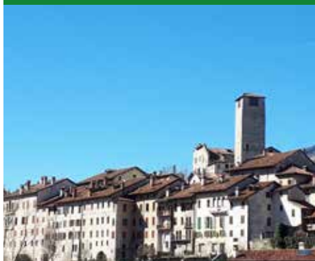
SCORCIO DEL PAESE

Le strade di Feltre sono i luoghi del racconto di personaggi che le hanno popolate nei secoli. Ognuno con le proprie peculiarità e con le proprie follie. Chi è diventato matto per il teatro, chi ha perso la testa per un amore non corrisposto, chi ha fatto dei suoi pazzi sogni il proprio mestiere, chi è uscito di senno tra documenti e archivi, chi è diventato folle per il lavoro. Una galleria di biografie feltrine da osservare come in un vividissimo museo della "sana follia" allestito lungo le vie della città.