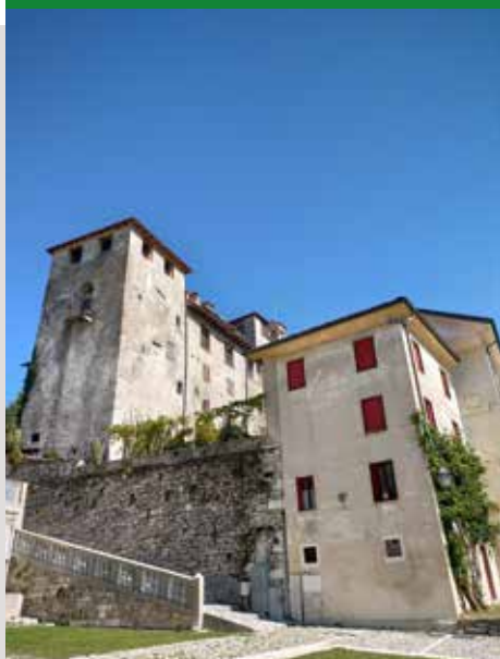
TORRE DELL'OROLOGIO DEL CASTELLO