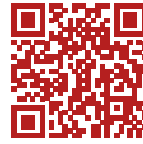
zum Golfplatz Kaiserwinkl Kössen

Sanft und waldig umgibt der Kaiserwinkl drei außergewöhnliche Plätze. Golfende spielen grenzüberschreitend, naturnah und eben im Tal, während das Kaisergebirge grüßt.