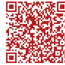
zum Golfplatz Reit im Winkl-Kössen