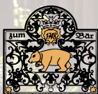
HOTEL ZUM BÄR

Die Tradition als Blumen- und Saatzuchtstandort ist in Quedlinburg deutlich sichtbar. Blumenkugeln zieren vom Frühling bis Herbst einige Straßen im Einkaufserlebnis historische Innenstadt. Dank unserer Sponsoren werden wir das Projekt in der Blasiistraße und im Steinweg, hin zum DRK, nochmals erweitern.