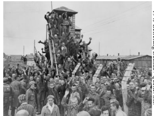
1945 Befreiung Dachau