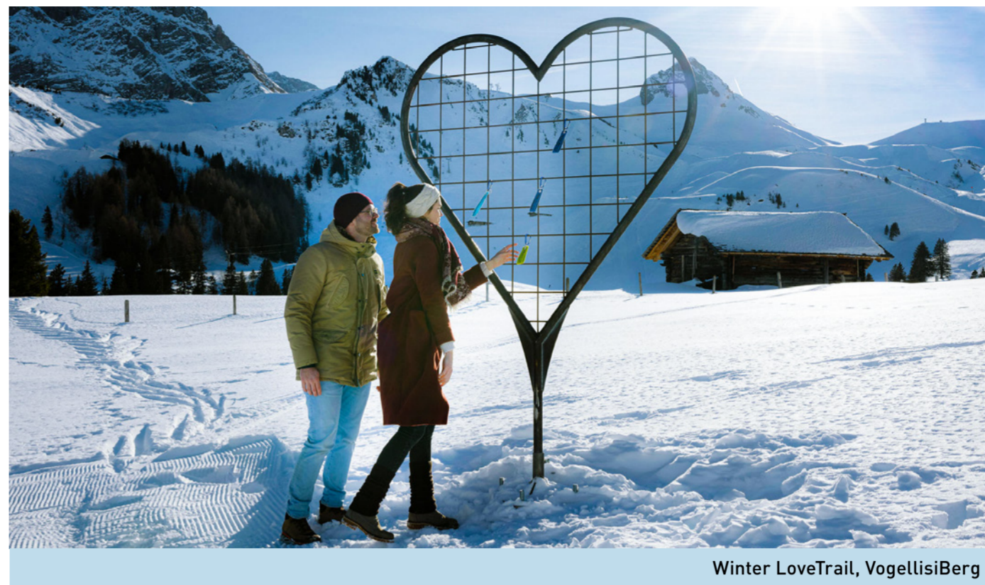
Winter LoveTrail, VogellisiBerg