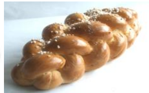
Hefezopf 500g, 250g mit Hagelzucker oder Mandeln bestreut