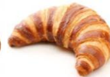
Laugencroissant Laugen-Butter- Croissant