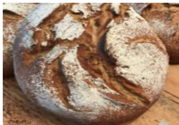
Visnitzer Laib 1kg Roggen, Dinkel, Malz, Natursauerteig