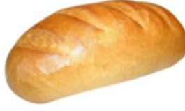
Weißbrot 250g, 500g