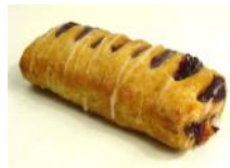
Kirsch-Vanilletasche Blätterteigtasche mit Kirsch-Vanillefüllung