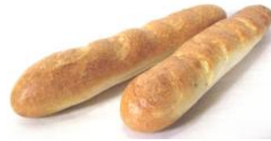
Baguette 250g, 500g