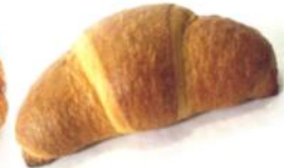
Schokocroissant Butter-Croissant mit Schokolade gefüllt