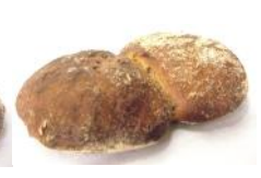
Südtiroler Paarl 230g

Roggenmischgebäck, mit Natur-Sauerteig, Fenchel, Kümmel, Brotklee