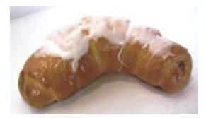
Nuß-, Mohnkipfel Hefeteiggebäck mit Haselnuß- oder Mohnfülle, Zuckerglasur