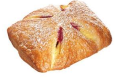
Himbeer-Vanilletasche Plundertasche mit Vanillecreme, Himbeeren