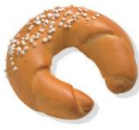
Briochekipferl Hefengebäck mit Zuckerstreusel