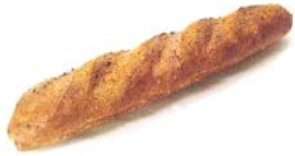
Dinkelbaguette 250g Dinkelvollmehl, Sesam, Leinsaat, Weizen, Roggen, Dinkelgrieß