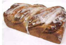
Nussstollen 500g gefüllt mit feiner Haselnussfülle, Zuckerglasur