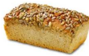
Glutenfrei 500g Gluten- und Lactosefreies Zöliakie -Brot mit Sesam, Soja, Sonnenblumenkerne