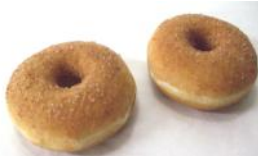
Donuts Hefengebäck mit Zimt-Zucker