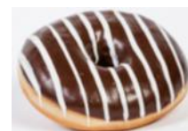
Nougatdonut gefüllt mit feiner Nougatcreme, glasiert