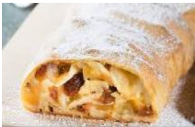
Apfelstrudel Apfel, Rosinen, Nüsse, Brösel, Zimt und Zucker