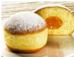
Krapfen (Berliner) Siedegebäck mit Marillenmarmelade