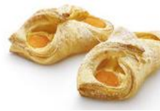
Marillentasche Plundergebäck mit Marillen und Vanillecreme