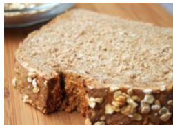
Haferbrot 500g Helles Hafer-Weizenmischbrot, Haferflocken