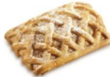
Apfel-Topfen-Schnitte mit saftiger Apfel- und Topfen(Quark)füllung