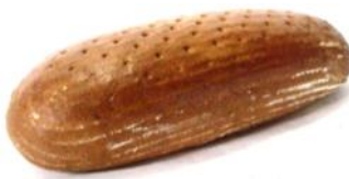
Schwarzbrot 500g, 1kg

Mischbrot aus Roggen und Weizen, mit Natur-Sauerteig und Brotgewürz