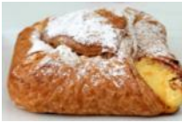
Topfentasche Plundergebäck mit Quarkfüllung, gezuckert