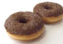
Schokodonuts gefüllt und überzogen mit Milkschokolade