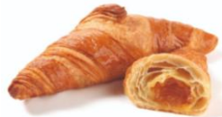
Marillen-Croissant mit Marillen- marmelade gefüllt