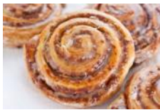
Nusschnecken Hefeteigschnecken mit Nussfülle oder Marzipan