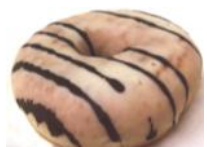
Puddingdonut gefüllt mit Vanillepudding, glasiert