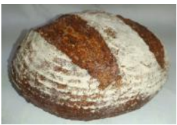
Dinkel-Honig-Brot 500g Dinkellaib mit Bienenhonig