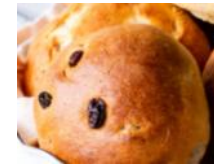
Milchbrötchen Hefefeingebäck mit Rosinen