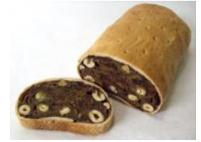
Zelten 1kg, 500g Nüsse, Rosinen, Feigen, Rum, Roggen, Weizen, Natur- Sauerteig, Gewürze