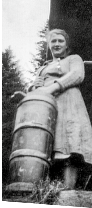
Sennerin bei der Milchverarbeitung, Mölltal 1940