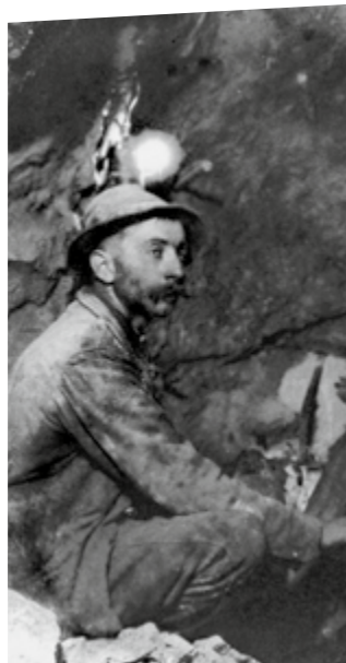
Bergarbeiter, k. u. k. Kiesbergbau, Großfragant, um 1916