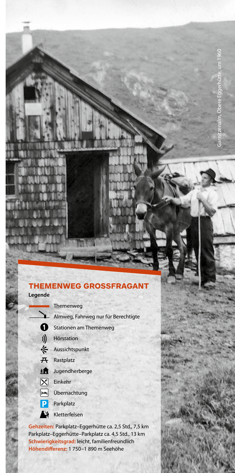
Garnitzental, Obere Eggerhütte, um 1960