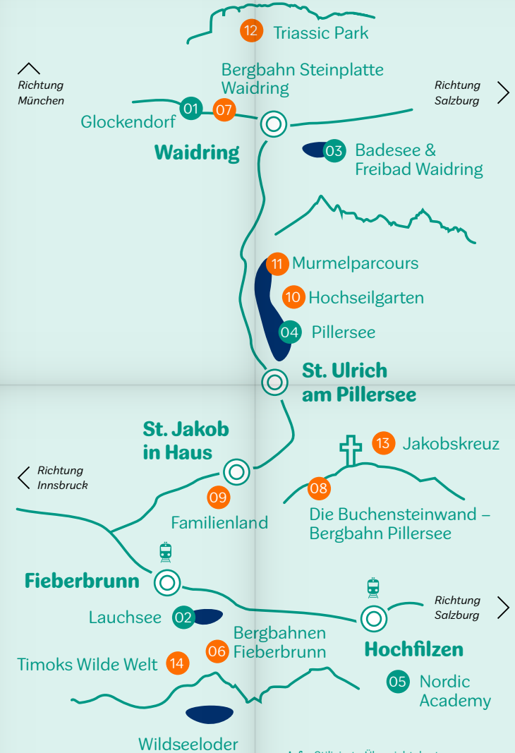
Info: Stilisierte Übersichtskarte, keine naturgetreue Abbildung!