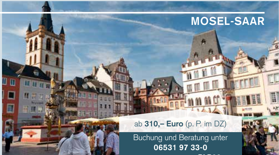
Hauptmarkt Trier, Mosel-Saar