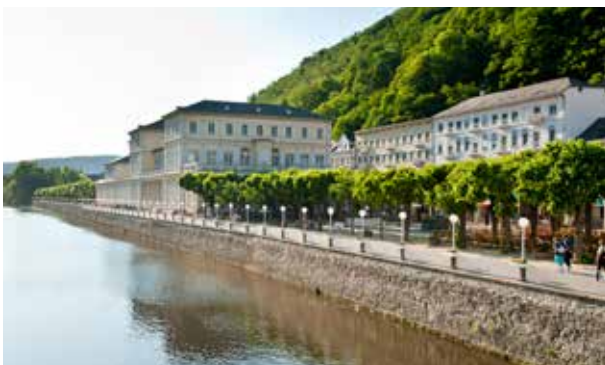
Bad Ems, Lahntal

Die „Emser Therme“ in Bad Ems ist im wahrsten Sinne des Wortes die Therme am Fluss. Nach dem Saunagang und einer Runde im Thermalbecken können Sie auf der Terrasse direkt an der Lahn entspannen. In modernem, ansprechendem Ambiente erwartet Sie entspannendes Emser Thermalwasser, Saunen, Wellness, Fitness und ein Thermenrestaurant. Die Emser Therme ist ideal für den kleinen Urlaub zwischendurch.