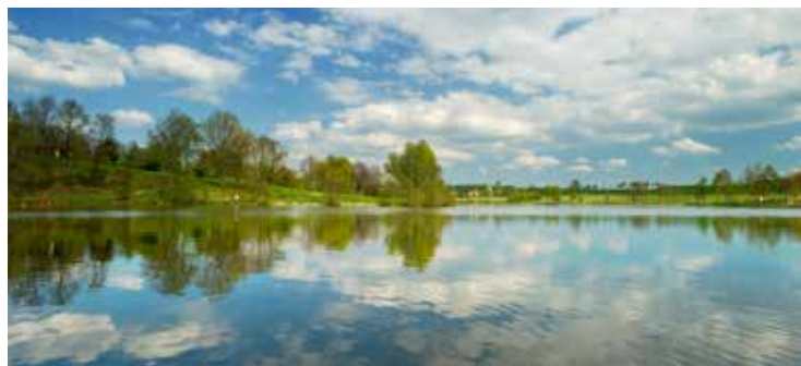
Kell am See, Hunsrück

Sind Sie auch gerne mit dem Rad unterwegs, empfiehlt sich der Rheinradweg . Ob mit E-Bike oder normalem Fahrrad, hier radeln Sie ganz gemütlich direkt am Rhein entlang, zum Beispiel von Bacharach bis nach Boppard . In Boppard angekommen, stellen Sie Ihr Rad ab und fahren mit der Seilbahn hinauf zum Gedeonseck . Von diesem Aussichtspunkt haben Sie eine fantastische Sicht auf die Rheinschleife und den Bopparder Hamm . Kleiner Tipp: Statt wieder zurückzuradeln, können Sie samt Fahrrad auch auf eines der Ausflugsschiffe