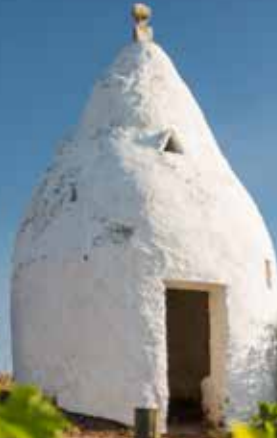
Trullo nahe Flonheim, Rheinhessen