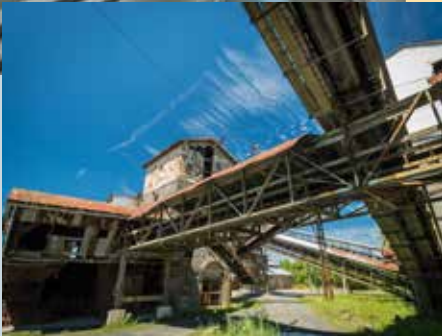
Stöffel-Park, Enspel, Westerwald