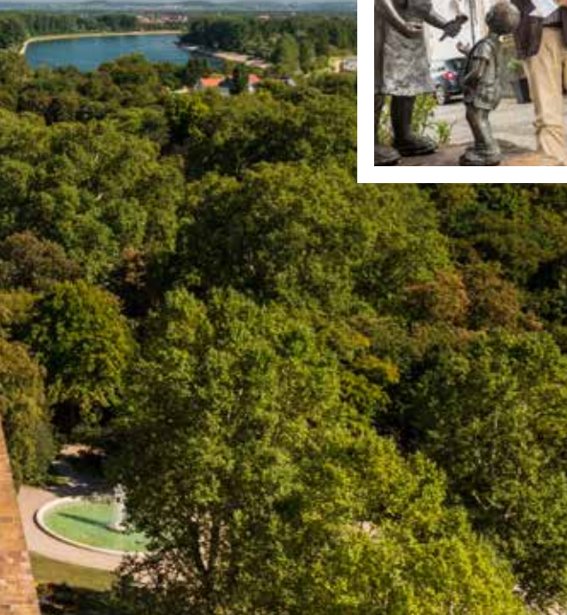
Dom zu Speyer, Pfalz

Städten Speyer und Mainz . Gemeinsam haben sie als „SchUM-Städte am Rhein – Jüdisches Erbe für die Welt“ einen UNESCO-Welterbeantrag gestellt. SchUM ist übrigens ein Akronym aus den Anfangsbuchstaben der mittelalterlichen, auf Latein zurückgehenden hebräischen Namen der drei Städte (Schpira, Warmaisa, Magenza). 1084 siedelte sich auf Veranlassung des Bischofs Rüdiger Huzmann in Speyer eine der ersten Jüdischen Gemeinden im Heiligen Römischen Reich an. Ein Stadtbummel entführt Sie sowohl in die christliche als auch in die jüdische Vergangenheit Speyers. Dom und Synagoge, Mikwe und Alte Münze, historisches Rathaus und jüdischer Friedhof zeugen von der gemeinsamen Historie. Eine Pause sollten Sie sich unbedingt auf dem Fischmarkt, dem „Treffpunkt am Stelzenfisch“, gönnen – wie eine Oase liegt er in der geschäftigen Altstadt. Bei einem Gläschen Wein und leckeren kulinarischen Kleinigkeiten können Sie hier in Ruhe Kraft tanken. Weiter rheinabwärts liegt das Städtchen Boppard mitten im UNESCO-Welterbe „Oberes Mittelrheintal“. Schlendern Sie entlang der Rheinpromenade und besuchen Sie die Thonet-Ausstellung in der Kurfürstlichen Burg. Oder fahren Sie von hier mit dem Schiff in Richtung Loreley oder Marksburg .