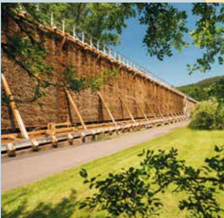
Gradierwerk, Bad Kreuznach, Nahe