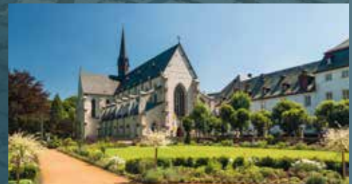
Abtei Marienstatt, Westerwald