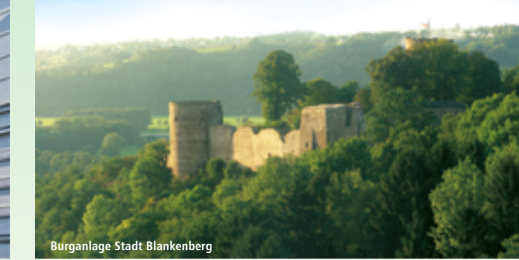
Burganlage Stadt Blankenberg