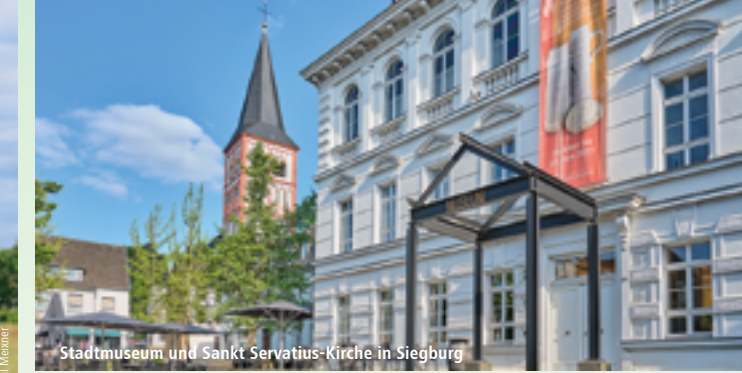
Stadtmuseum und Sankt Servatius-Kirche in Siegburg