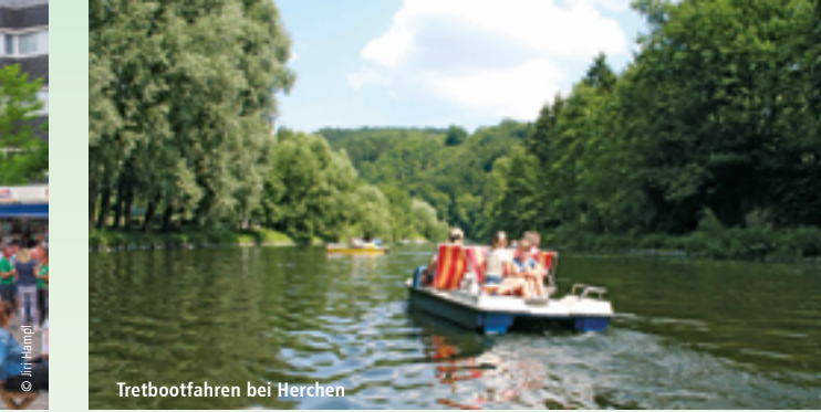
Tretbootfahren bei Herchen