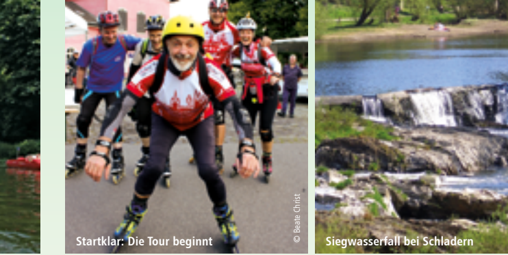
Startklar: Die Tour beginnt Siegwasserfall bei Schladern