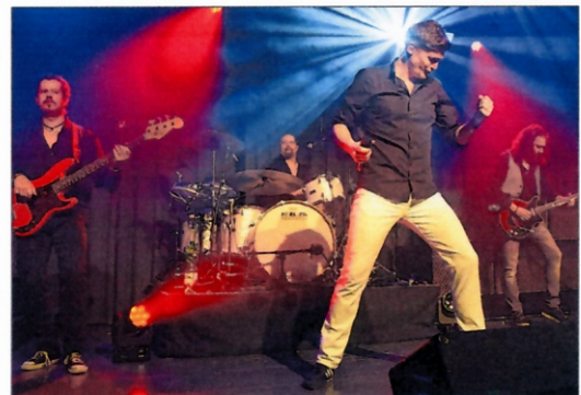
Die Band „We Rock Queen“ brachte das Gefühl ins Bürgerhaus, als stünden dort die einstigen Erfolgsmusiker um Freddie Mercury.

Mit einem einmaligen Mix aus höchster Qualität und unvergleichlicher Freude an der gemeinsamen Musik brachten die Künstler auch den letzten Fuß der rund 400 Musikbegeisterten in Bewegung und lieferten ihren Zuschauern einen unvergesslichen Abend voller Nostalgie, Emotionen und purer musikalischer Freude. Egal, ob Mutter, Teenie oder eingefleischter Rocker: Hier kam wirklich jeder auf seine Kosten. Im Publikum hörte man Begeisterung von allen Seiten: „Ich war bereits im Musical „We will rock you“ in Köln und jetzt hier und bin einfach nur begeistert“, verriet ein faszinierter Zuhörer im SZ-Gespräch. Derzeit tourt die Band durch ganz Deutschland und begeistert ihr vielschichtiges Publikum in rund 20 verschiedenen Locations im Jahr. Gemeinsam feierte man mit „We Rock Queen“ ein einmaliges musikalisches Rock-Highlight und sang bei zahlreichen Zugaben und ausgelassener Stimmung „The show must go on“ bis in den späten Abend hinein.