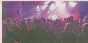
Über 400 Musikfans ließen es sich nicht nehmen, die Hits von Queen live zu erleben.