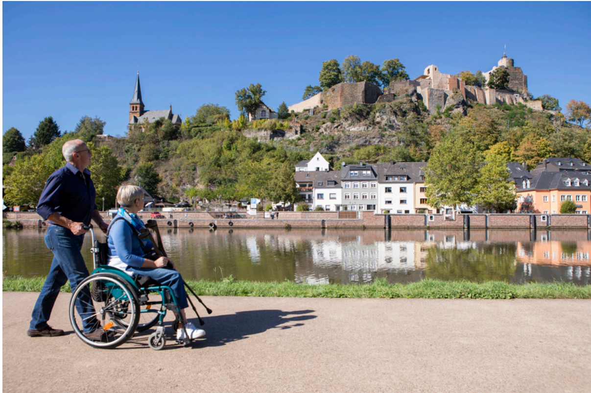
Burganlage Saarburg