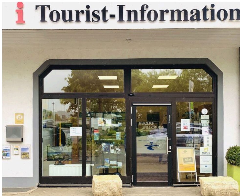
Tourist-Information Konz