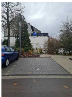
PKW-Stellplatz für Menschen mit Behinderung

Wir haben für Sie einige Fotos aus dem Betrieb / Angebot zusammengestellt. In den Detailberichten finden Sie weitere Fotos.