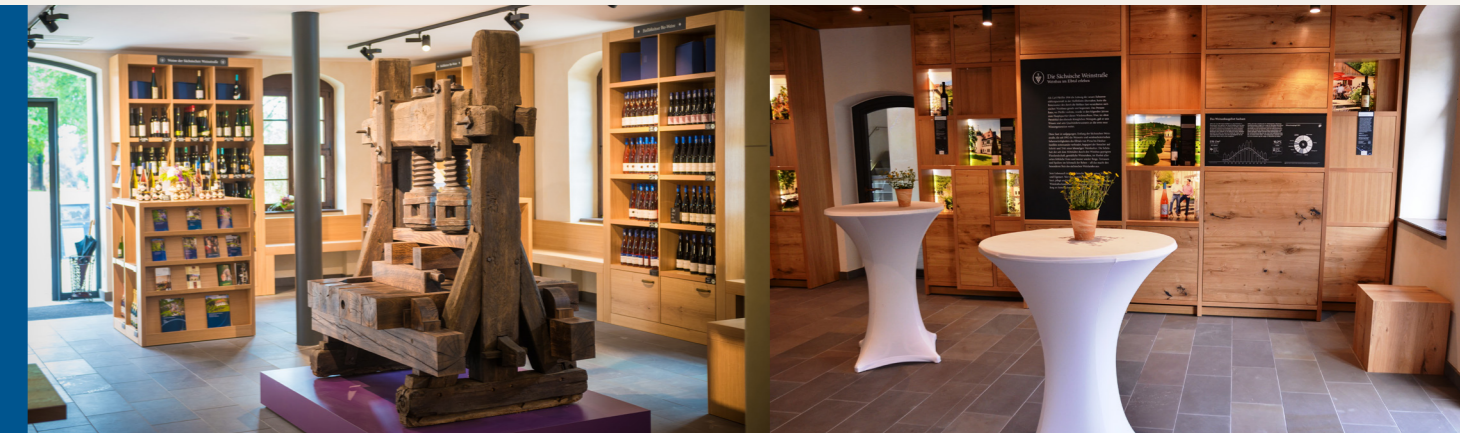
touristischer Servicepunkt und Weinverkauf

Direkt angrenzend befindet sich der Sächsische Weinschauraum. Hierin werden die sächsischen Weingüter und Winzer mit Bild, Kurzporträt und Produkt vorgestellt. Darüber hinaus gibt es multimedial aufbereitete Informationen zum Weinanbaugebiet Sachsen, zu den Weingütern, den Winzern sowie den touristischen Highlights im Anbaugebiet.