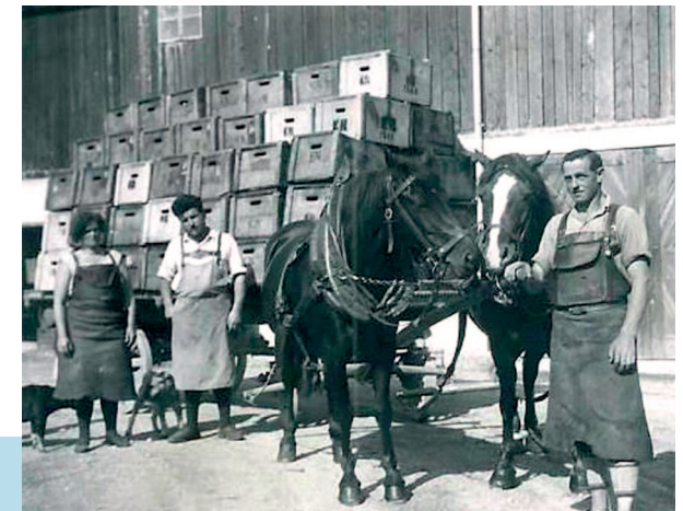
Seefeld, Bier- und Getränkelager beim „Jagermartl“

Sie zeigen uns Straßenzeilen, Häuser, Einrichtungen, Bräuche, bäuerliche Arbeit, Feste oder Bekleidungen, die es so nicht mehr gibt. Aber die Bilder können uns auch emotional berühren und zum Nachdenken darüber anregen, wie sich das „Leben im Dorf“ seit Ende des 19. Jahrhunderts – aus dieser Zeit sind bereits vermehrt Fotodokumente aus unserer Region erhalten – verändert