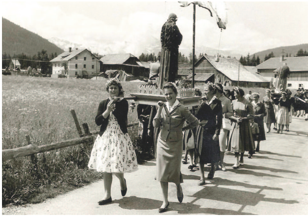
Leutasch, Kirchplatzl, Prozession, um 1964

Wir leben in einer Zeit der digitalen Bilderflut. Sie beherrscht nicht nur den öffentlichen Raum, sondern ebenso den privaten Bereich. Nahezu alle Altersklassen benutzen ihre Mobiltelefone, um sich, ihre Umgebung oder bestimmte Ereignisse zu fotografieren und dies dann mit anderen zu teilen. Die Fotografien dagegen, die Sie in diesen Ausstellungen sehen, stammen aus einer ganz anderen Zeit.