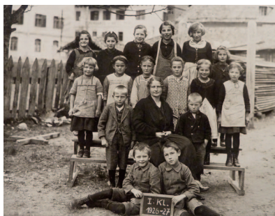
Seefeld, 1. Klasse der Volksschule, 1926/27