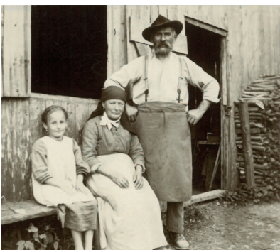
Mittenwald, beim „Spackerle“, 1923