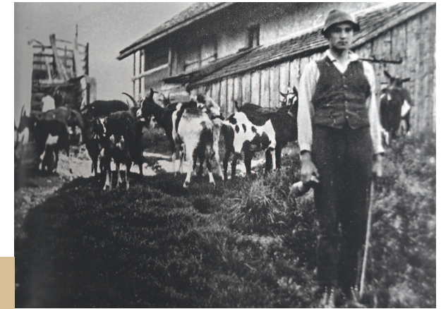
Scharnitz, Ziegenhirte, um 1935

Sie zeigen uns Straßenzeilen, Häuser, Einrichtungen, Bräuche, bäuerliche Arbeit, Feste oder Bekleidungen, die es so nicht mehr gibt. Aber die Bilder können uns auch emotional berühren und zum Nachdenken darüber anregen, wie sich das „Leben im Dorf“ seit Ende des 19. Jahrhunderts – aus dieser Zeit sind bereits vermehrt Fotodokumente aus unserer Region erhalten – verändert