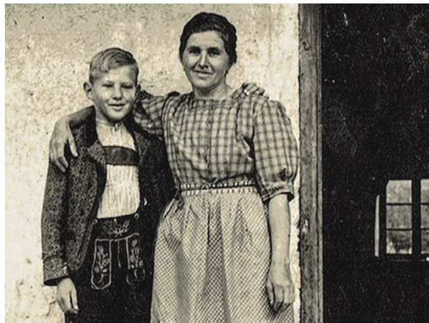
Leutasch, vor dem „Itzelerhof“, 1940er Jahre

Die ältesten Bilder haben in den Familien über fünf Generationen – wie ein Schatz behütet – weit über hundert Jahre überstanden. Bis weit in das 20. Jahrhundert hinein wurden die meisten Fotos auch nicht selbst mit einem eigenen Gerät sondern von ausgebildeten Berufsfotografen aufgenommen. Alte Fotografien sind für uns heute ein wertvoller dokumentarischer Schatz.