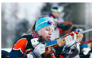
Visez l'hiver !