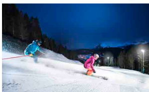
À vos pistes, prêts, feu, partez !