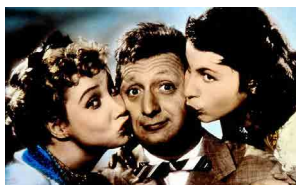
Une sensation de nostalgie ...