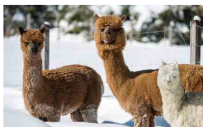
Randonnée aux lanternes avec des alpagas