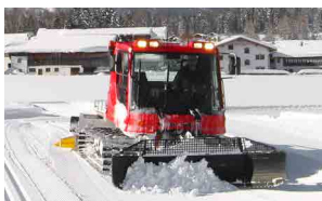
Savoir damer comme un pro

Le programme d'activités hivernales offre 17 AVENTURES INCROYABLES pour tous âges ! EN EXCLUSIVITÉ ET GRATUITEMENT avec l' OLYMPIAREGION SEEFELD CARD !