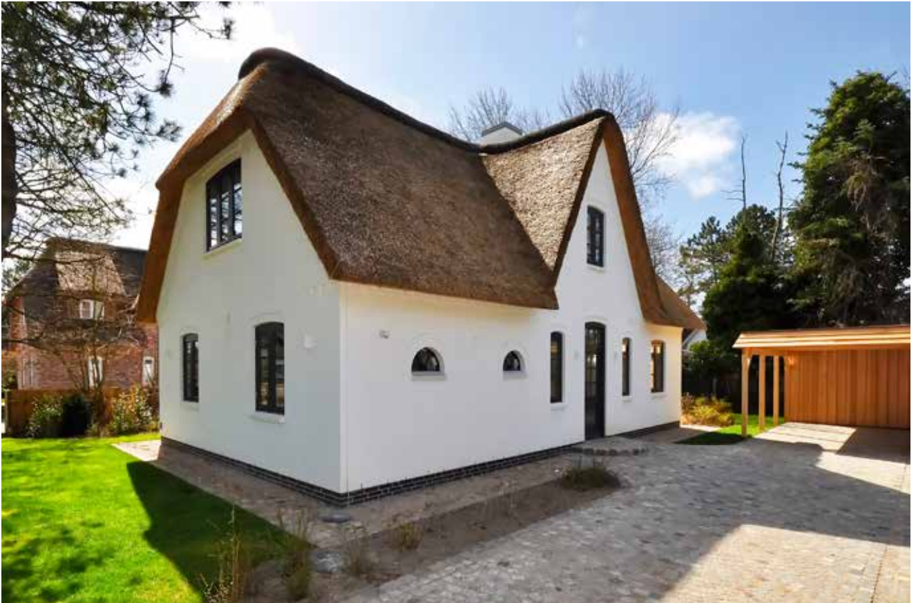
KOCH &amp; CO. FERIENDOMIZILE GMBH