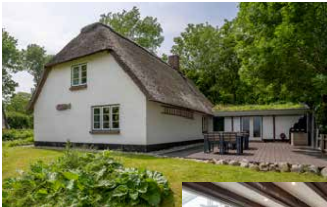
Hygge unter Reet - Westerhever