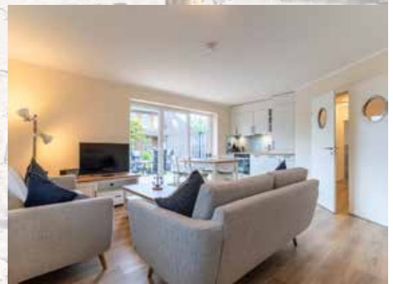
Ordinger Strandfuchs - St. Peter-Ording