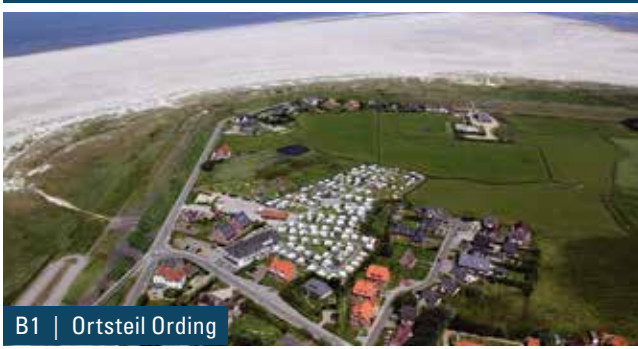
B1 | Ortsteil Ording