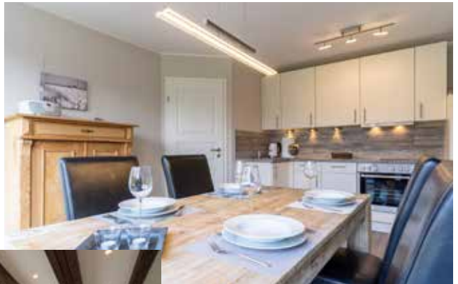
Ferienhaus Gestrandet - St. Peter-Ording