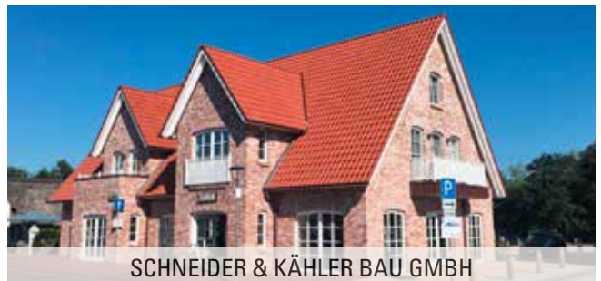
SCHNEIDER &amp; KÄHLER BAU GMBH