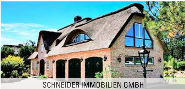
SCHNEIDER IMMOBILIEN GMBH