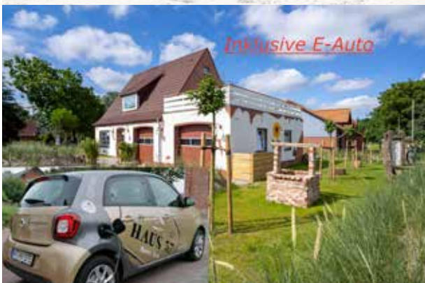
Haus 57 - Fating