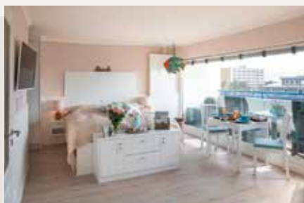
App. WATT-Blick 48