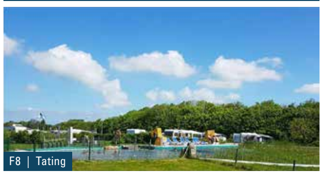
F8 | Tating

Klugmann GmbH & Co. KG Utholmer Straße 1 25826 St. Peter-Ording Tel. (04863) 9601-0 Fax (04863) 9601-99 info@campingplatz-biehl.de www.campingplatz-biehl.de