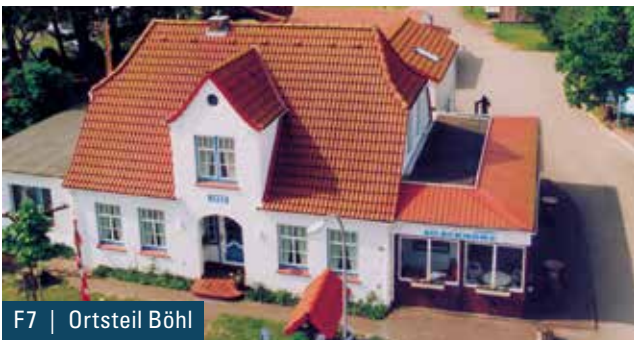
F7 | Ortsteil Böhl