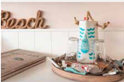
App. WATT-Blick 31