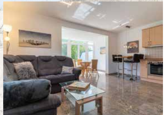
Haus Esel - 4 Wohnungen direkt am Strand

Bei uns finden Sie das passende Ferienhaus oder die richtige Ferienwohnung für bis zu 8 Personen für Ihren Urlaub in St. Peter-Ording, in allen umliegenden Ortsteilen oder auf der Halbinsel Eiderstedt sowie in Büsum.