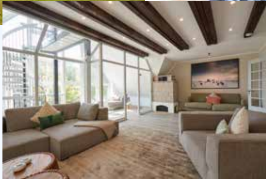
Haus Yacht - St. Peter-Ording - für 8 Personen