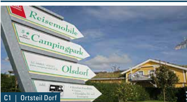
C1 | Ortsteil Dorf