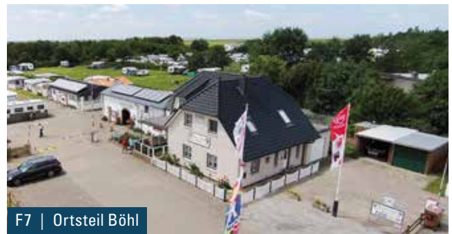
F7 | Ortsteil Böhl