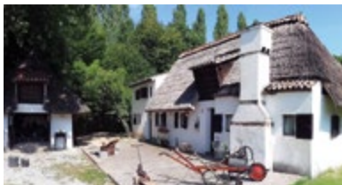
CASONE RAMEI via Ramei - Piove di Sacco (Pd)