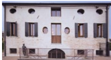
CASA MARITAN via San Marco, 66 Sant'Angelo di Piove (Pd)