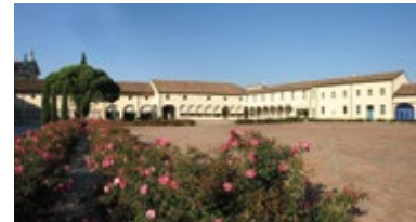
CORTE BENEDETTINA via Roma, 34 - Legnaro (Pd)