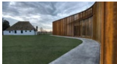
CASONE AZZURRO strada San Marco, 9 - Arzergrande (Pd)