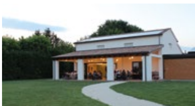
AGRITURISMO CARESÀ via Ospitale, 32a - Brugine (Pd)