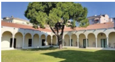
MUSEO DIOCESANO DI ARTE SACRA rione Duomo - Chioggia (Ve)