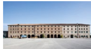
PALAZZO ROMANIN JACUR via Beverare, 16 - Piove di Sacco (Pd)