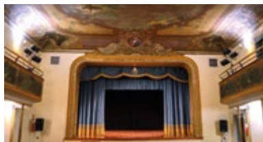
TEATRO FILARMONICO piazza Matteotti, 5/7 - Piove di Sacco (Pd)