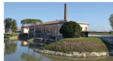
IDROVORA DI S. MARGHERITA via Idrovora, 7 - Codevigo (Pd)