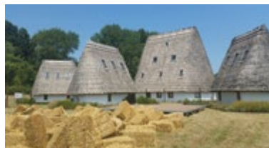
CASONI DELLA FOGOLANA via Cason delle Sacche, 8 - Codevigo (Pd)