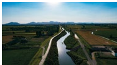
AZIENDA ASJA RIGATO via Brea, 7/A - Bovolenta (Pd)