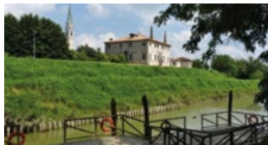
LA PONTA Bovolenta (Pd)