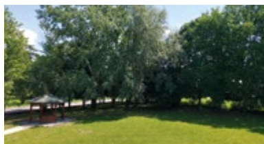
COOPERATIVA MAGNOLIA via G. di Vittorio, 6 - Piove di Sacco (Pd)