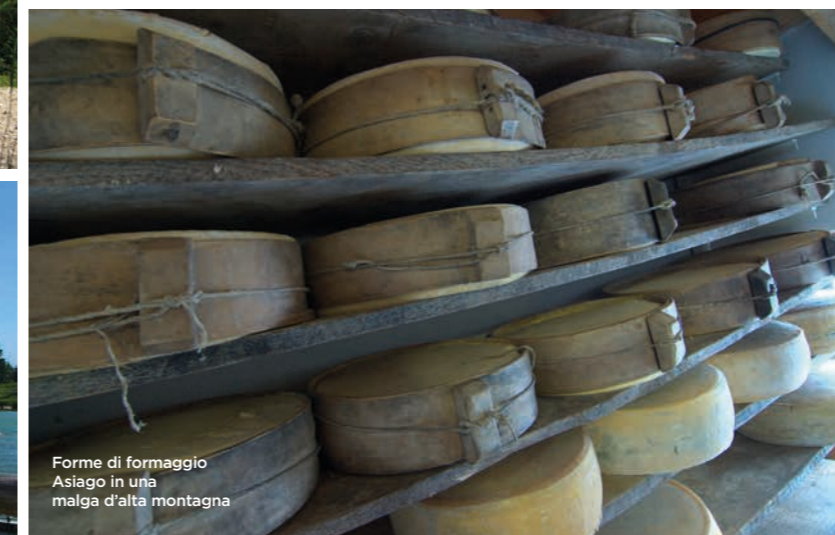
Forme di formaggio Asiago in una malga d'alta montagna

Nella stagione autunnale è sorprendente passeggiare con i bambini tra i caldi colori dei nostri faggi per ammirare le sculture in legno di personaggi fiabeschi che sembrano prendere vita; oppure visitare il museo dei "Cuchi", gli antichi coloratissimi fischietti artigianali di terracotta che un tempo erano dati in dono alla propria amata in segno di pegno d'amore.