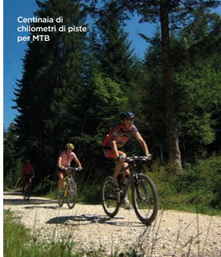
Centinaia di chilometri di piste per MTB

Nella stagione autunnale è sorprendente passeggiare con i bambini tra i caldi colori dei nostri faggi per ammirare le sculture in legno di personaggi fiabeschi che sembrano prendere vita; oppure visitare il museo dei "Cuchi", gli antichi coloratissimi fischietti artigianali di terracotta che un tempo erano dati in dono alla propria amata in segno di pegno d'amore.