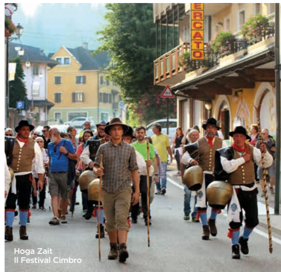
Hoga Zait Il Festival Cimbro

La lingua cimbra proviene dall'area linguistica bava-ro-tirolese ed è parlata ancora oggi a Roana, a Giazza (nella Lessinia veronese) e a Luserna (in provincia di Trento). Come risulta da testimonianze storiche, i cimbri erano popolazioni di derivazione nordica che su indicazione dei rappresentanti imperiali o degli ordini religiosi, emigravano dalla Germania meridionale alla ricerca di terre libere e sicure nelle quali poter vivere, come le Alpi del sud e l'Altopiano dei Sette Comuni. In queste piccole oasi dunque, organizzavano la loro quotidianità conservando lingua, cultura e costumi. Oggi dopo moltissimi anni, la testimonianza cimbra è presente in varie iniziative tra cui il museo etnografico di Roana, corsi di lingua organizzati dall'omonimo Istituto di Cultura oppure in festival come Hoga Zait che propone musiche tradizionali, piatti tipici e costumi storici, dei personaggi fiabeschi o dei miti che un tempo popolavano i paesi del nostro Altopiano.