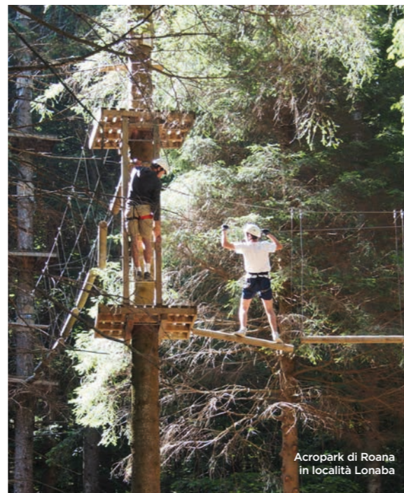
Acropark di Roana in località Lonaba

In alternativa si può pensare di rilassarsi nelle nostre piscine al coperto o di trascorrere fantastiche giornate con un buon gelato e un tuffo nella piccola oasi balneabile del laghetto Lonaba di Roana. Sempre qui, nel periodo estivo consigliamo la scuola di pony, dove i bambini potranno imparare ad andare a cavallo in tutta sicurezza grazie ad istruttori qualificati. Se invece si ama provare forti emozioni non resta che scegliere l'Acropark, un parco avventura di sessantuno percorsi con difficoltà diverse dove ci si fa avvolgere dal profumo del bosco. Se si è appassionati di ciclismo non può mancare un'esperienza sulla nuova ciclabile che mette in collegamento l'Altopiano di Folgaria con quello dei Sette Comuni, attraversando i paesi trentini di Luserna e Lavarone, fino ad arrivare nei centri veneti di Rotzo, Roana, Asiago e Gallio.