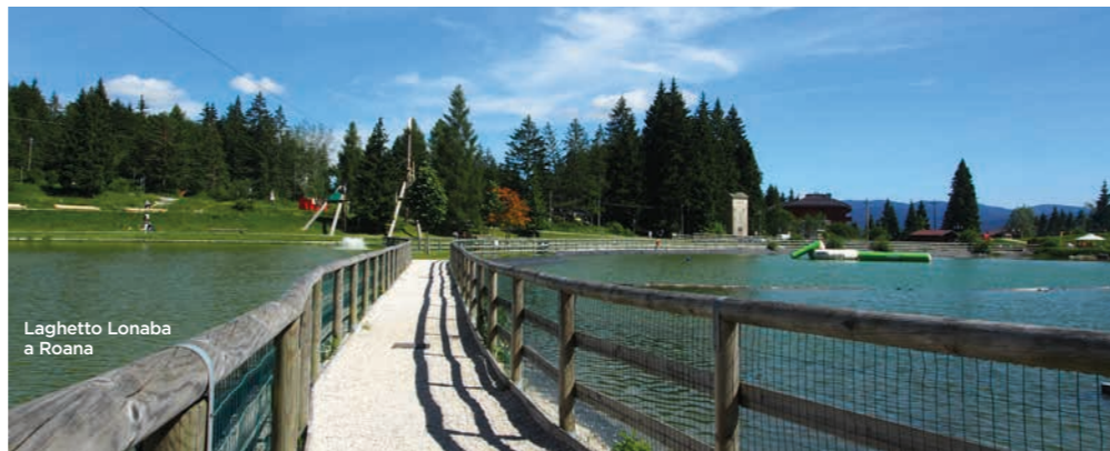
Laghetto Lonaba a Roana

In famiglia, con amici o da soli, qui in Altopiano troverete sempre attività adatte alle vostre esigenze. D'estate ci si può immergere nella tranquillità della natura scegliendo uno degli innumerevoli percorsi che offre la nostra dolce montagna per arrivare nel mondo rurale delle malghe alla ricerca di formaggi locali arricchiti con fiori ed erbe spontanee, buonissimi anche abbinati alle marmellate e ai mieli tipici.