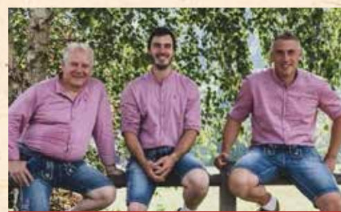
A tutto Folk con i SIVER MUSICH!