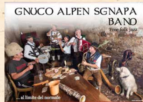
A ritmo di musica con la GNUCO ALPEN SGNAPA BAND!

Partenze presso il punto informativo in piazza