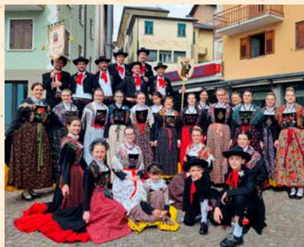
Gruppo Folk di Castel Tesino