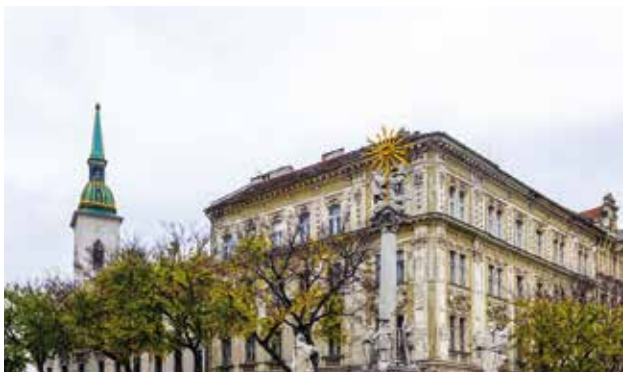
Repubblica Slovacca Slovenská Republika