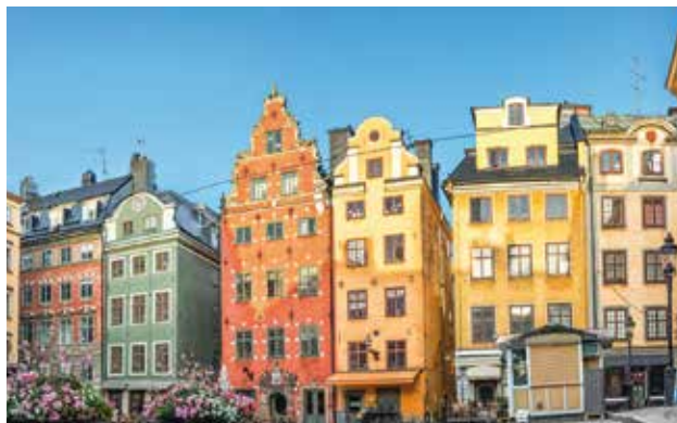
Regno di Svezia Konungariket Sverige