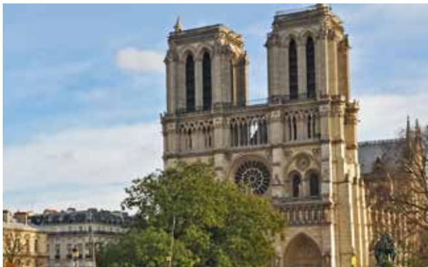
Repubblica Francese République française