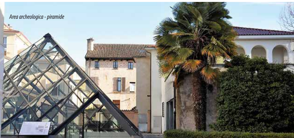
Area archeologica - piramide

Associazione Athena – associazioneathena@virgilio.it