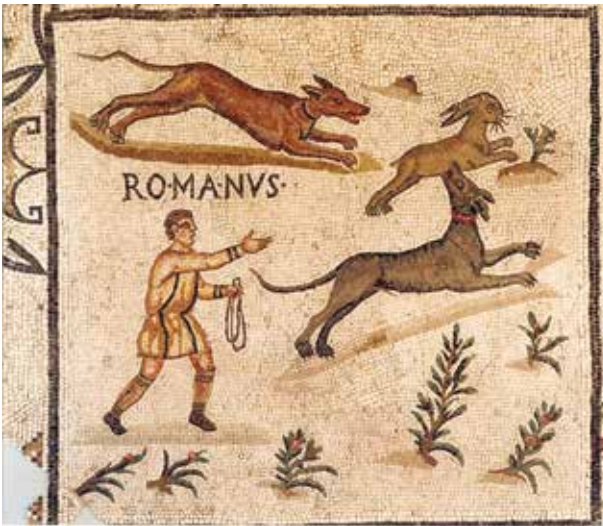
Mosaico con scena di caccia alla lepre, inv. n° MC 557