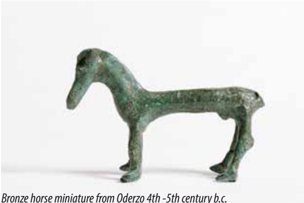
Bronze horse miniature from Oderzo 4th -5th century b.c.

Roman finds are also kept on the ground floor where daily life objects are exhibited together with lots of tombstones including busts, a collection of coins and bronze statues, precious heads/portraits and famous mosaics of the late Roman times (such as “The Hunt”, “Romanus” and the “Man holding a cup” mosaics).