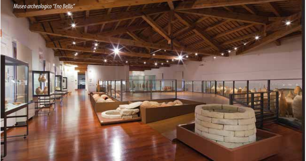
Museo archeologico "Eno Bellis"