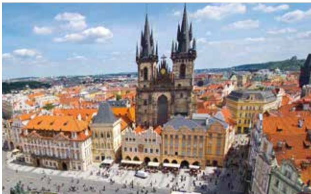
Repubblica Ceca Česká republika