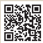
Immagine di copertina:

Giambettino Cignaroli (attr.), Musei Veronenis Prospectus et Ichonographia (dettaglio),