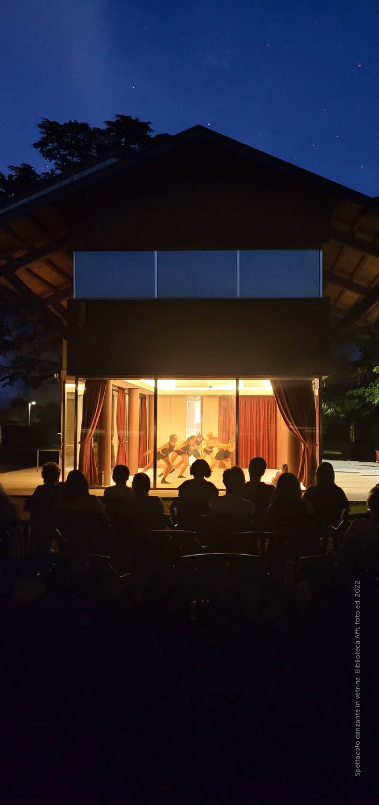
Spettacolo danzante in vetrina. Biblioteca Affi, foto ed. 2022