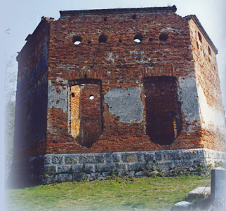
Prima e dopo il restauro del 2005