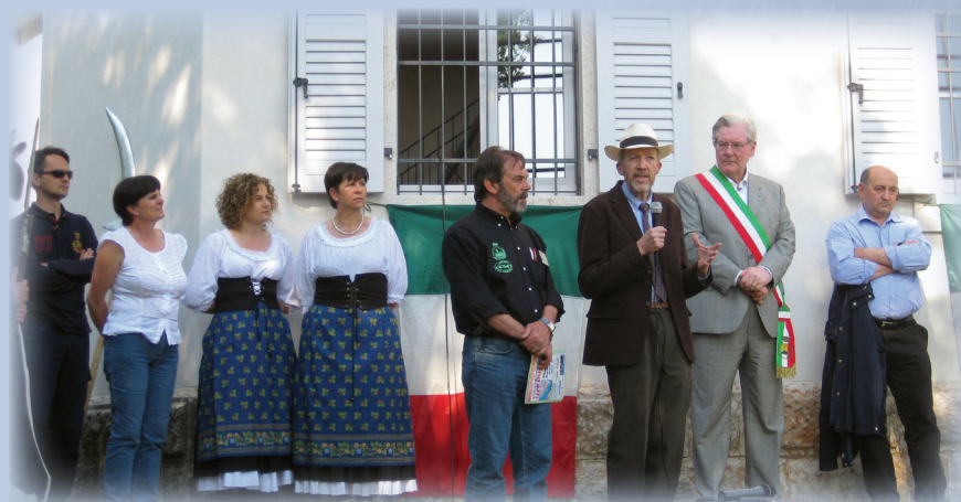
Inaugurazione Telegrafo 3 maggio 2009