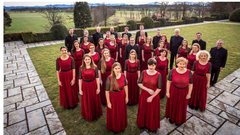
APZ FRANCE PREŠEREN KRANJ• SI dir.: Erik Šmid Cat. B1 & F