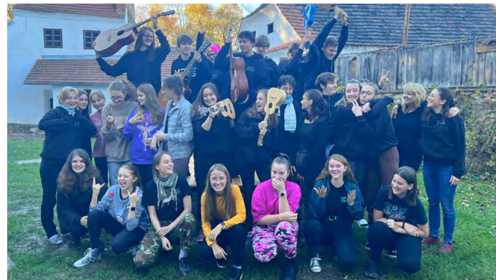
BIGYSBOR • CZ dir.: Anna Voříšková Cat. G3