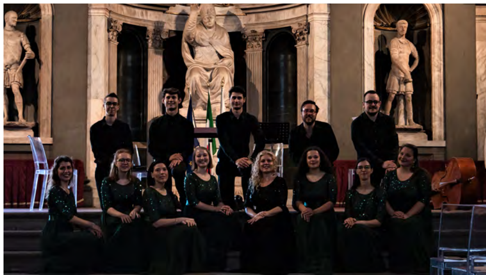
GRUPPO VOCALE VIRIDITAS • IT dir.: Francesca Paola Geretto Festival