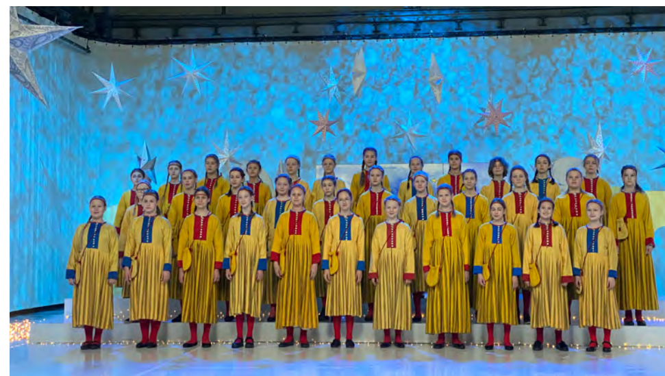
ESTONIAN TV CHILDREN'S CHOIR • EE dir.: Aarne Saluveer & Silja Uhs Cat. G1 & F