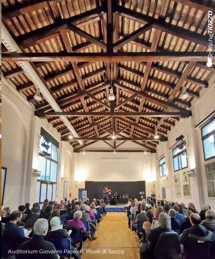
Auditorium Giovanni Paolo II, Piove di Sacco