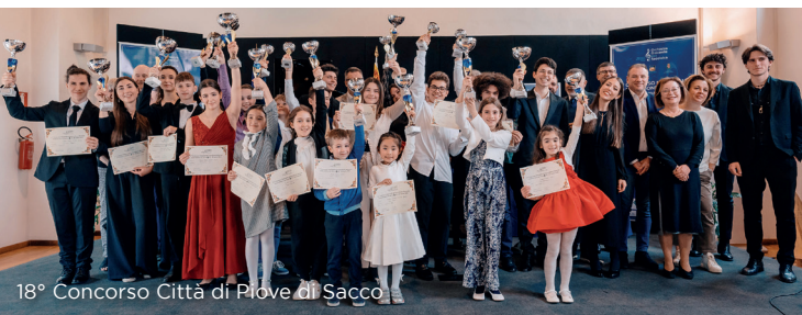
18° Concorso Città di Piove di Sacco