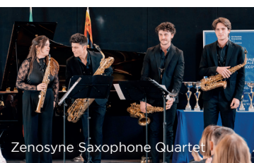
Zenosyne Saxophone Quartet